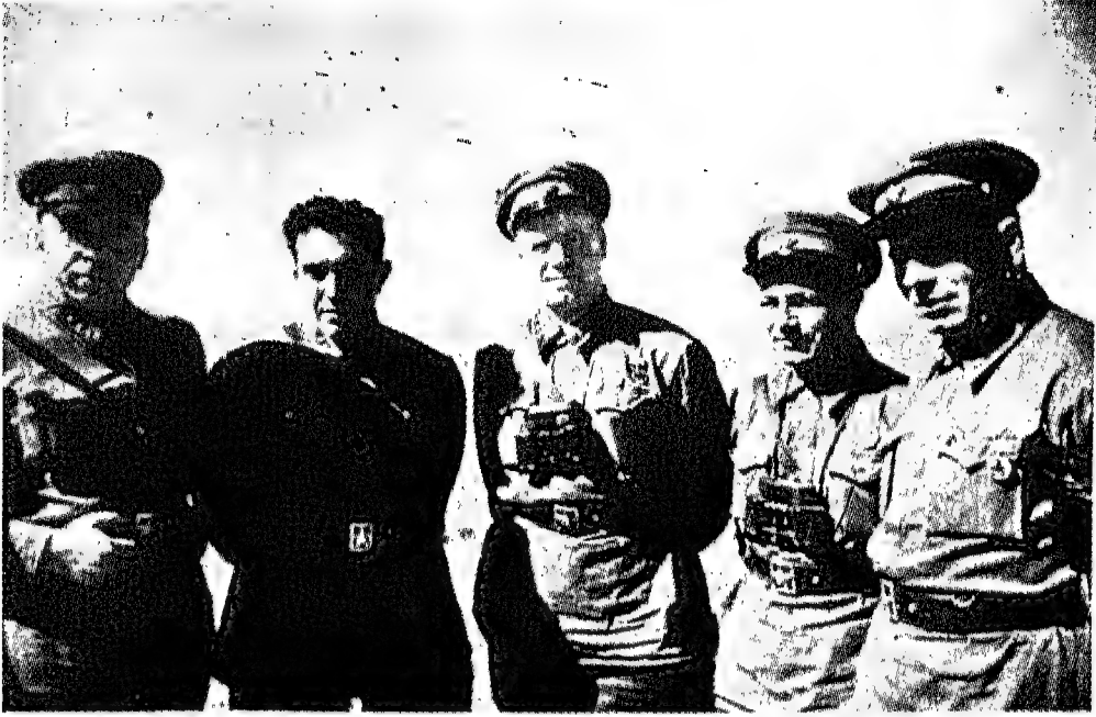
المارشال جوكوف بطل معركة ستالينغراد في صورة له مع كبار الضباط أثناء الحرب. وقد كرمته القيادة الروسية مؤخراً في الذكرى الخمسين للحرب العالمية الثانية.

كان ستالين كل ساعتين أو ثلاثاً يطالب بتقرير من ستالينغراد، ويتحدث مراراً بالهاتف مع جوكوف وفاسيليفسكي الذي أرسله إلى هناك من جديد. أما المحادثات مع مالينكوف، فلم تكن تجلب له الرضى. كان ستالين قد أرسل هذا الرجل الذي لا حول ولا قوة في الشؤون الحربية، فقط بمثابة رقيب يذكر العسكريين بمطالب «الأعلى» ويجمع المعلومات حول عمل هيئات الأركان. لم يحصل لـ مالينكوف أن ذهب إلى الجبهة سوى مرة أو مرتين، أما باقي الوقت، فكان يتواجد إما في هيئة أركان أو في مكتب خاص، يستدعي إليه الموجهين السياسيين وقادة «الأقسام الخاصة». كان القادة العسكريون يتعاملون مع مالينكوف بلباقة، وبما أنهم يفهمون الدور الموكل إليه، لا يدخلون معه في أحاديث إلا بمبادرة منه.